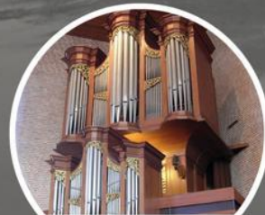
14:00 Bethelkerk Jurriaan Kokstraat 175