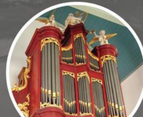
15:20 Oude Kerk Keizerstraat 8