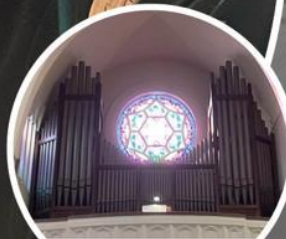
11:00 H. Antonius Abtkerk Scheveningseweg 233