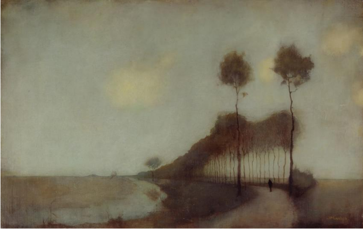
Afbeelding: Woudsterweg, schilderij van Jan Mankes

Vakantie! Tijd om ruimte te maken voor iets nieuws. Vele mensen trekken er op uit om plaatsen te bezoeken waar ze nog nooit eerder kwamen, maar waarvan ze vermoeden dat ze iets heel bijzonders hebben. Je kan –en dat is een minstens even spannende reis- ook proberen de dingen om je heen te bekijken met andere ogen. Het lezen van levensverhalen kan hierbij helpen. Onlangs las ik een boek over de Nederlandse schilder Jan Mankes (°1889 -†1920). Eén van zijn gedachten was de volgende: